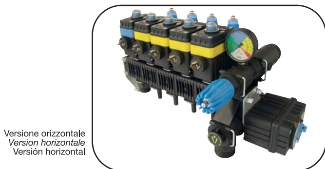
Versione orizzontale Version horizontale Versión horizontal

Todos los distribuidores Nergydrops PRO se pueden suministrar también en versión vertical para facilitar la instalación en su máquina. En el pedido especificar el código de la versión horizontal presente en el catálogo y agregar al lado del código la abreviación: "VERT".