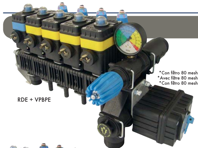
RDE + VPBE

* Con filtro 80 mesh * Avec filtre 80 mesh * Con filtro 80 mesh