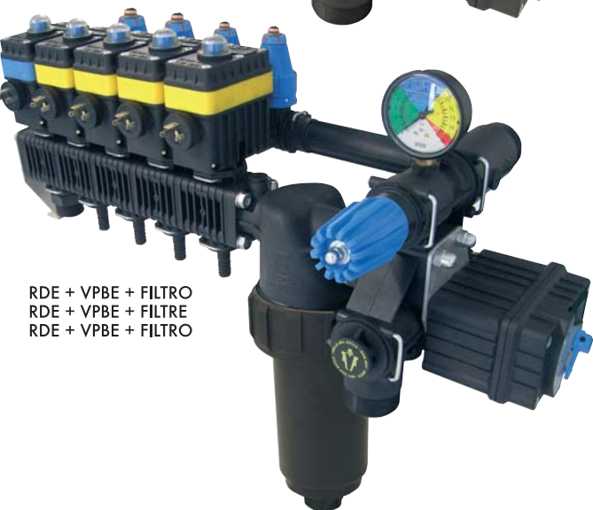
RDE + VPBE + FILTRO RDE + VPBE + FILTRE RDE + VPBE + FILTRO

* Con filtro 80 mesh * Avec filtre 80 mesh * Con filtro 80 mesh