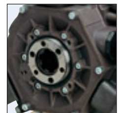
● POST. - REAR ● ARRIÈRE - POSTERIOR