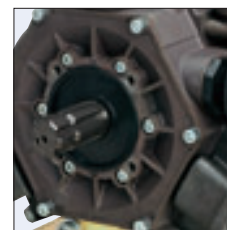
● POST. - REAR ● ARRIÈRE - POSTERIOR