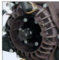
● ANT. - FRONT ● AVANT - ANTERIOR